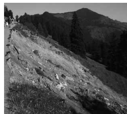
Sücca: Grosse Schäden durch Starkregenfälle

Informationen: www.cipra.org www.gletscher-archiv.de