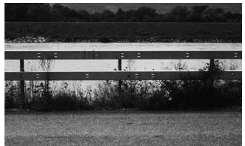
Alles im Lot? – nur Schein am «lebendigen» Rhein.