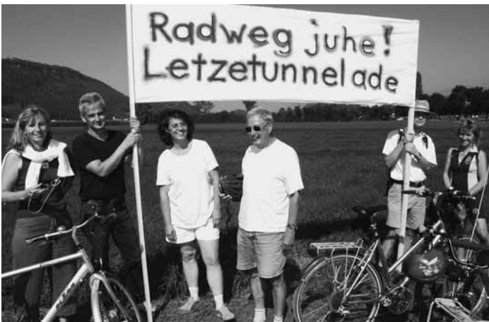
Letze-Strassentunnel: Es gibt Alternativen!