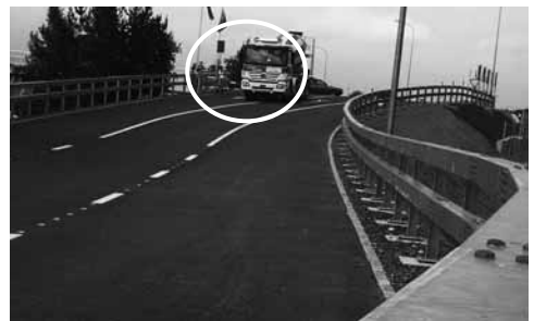
... Sicherheit? Nicht für alle: für FussgängerInnen ist hier Endstation.