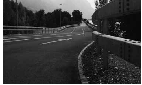
Autobahn Rheindamm Vaduz-Triesen – Bollwerk im Dienste der Sicherheit bei Tempo 80...

Nur wenige Meter rheinabwärts erstellt die Realschule Vaduz einen Planetenweg. Für die paar Stellen auf dem Wuhrweg ist ein Verfahren nach Naturschutzgesetz durchgeführt worden, bei dem insgesamt sechs Auflagen gesprochen wurden. Das ist richtig. Aber wir fragen uns trotzdem: Wo bleibt da die Verhältnismässigkeit?