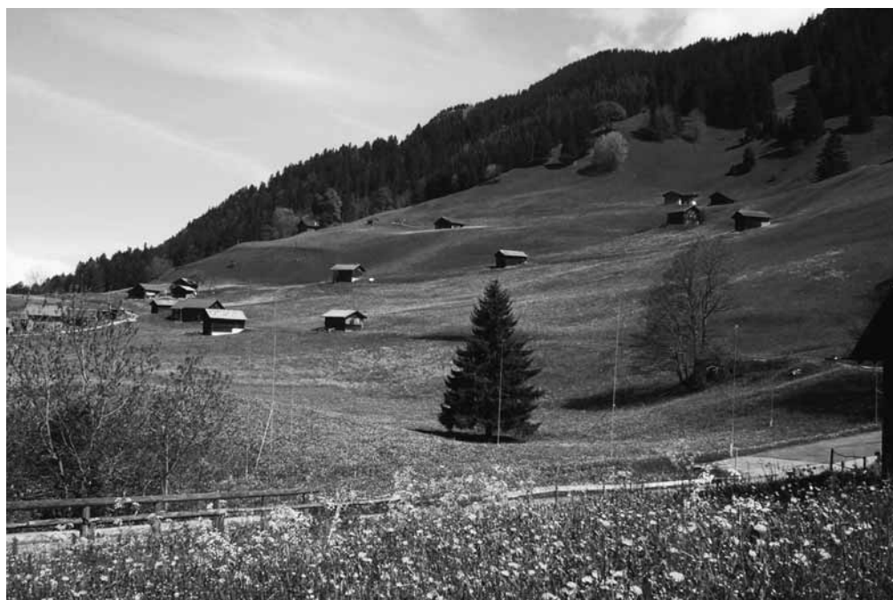
Bedrohtes Naherholungsgebiet Gnalper Ebene

Für komplexe Grossprojekte wie in Malbun fehlt in Liechtenstein ein wirksames Instrument zur koordinierten Prüfung der umweltrelevanten Strategien und Auswirkungen: Eine sogenannte «strategische Umweltverträglichkeitsprüfung». Wir bleiben dran.