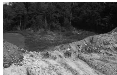
Deponie Eschner Au: lästige Altlast Tentschagraba

Die Produktionsbedingungen der Bauern in Triesenberg sind schlecht, die alten Ställe im Siedlungsgebiet stören die Wohnbevölkerung, sind unzeitgemäss und zu klein. Zur Erhaltung der Berglandwirtschaft in Triesenberg sollen in den nächsten Jahren drei bis fünf neue Landwirtschaftsbetriebe entstehen. Einer davon soll auf Gnalp zu stehen kommen. Aus Sicht des Landschaftsschutzes erachten wir den gewählten Standort für diesen gross dimensionierten