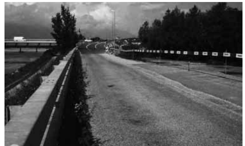
Fortsetzung folgt rechts: Vaduz, Triesen und das Tiefbauamt planen die Fortsetzung der Rheinstrasse.